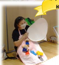
ボランティアさんによる 絵本の読み聞かせ